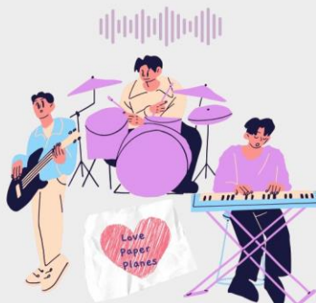
ทรงอย่างแบด (Bad Boy) - Paper Planes