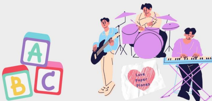
ทรงอย่างแบด (Bad Boy) - Paper Planes

เพลงถือเป็นสื่อที่ช่วยในการสร้างความบันเทิงสนุกสนาน และพัฒนาการของเด็ก ทุกครั้งที่มีโอกาสผู้ปกครองควรให้ความสนใจและเข้าไปมีส่วนร่วมในกิจกรรมสนุก ๆ กับเสียงดนตรีกับเด็กด้วย ซึ่งถือเป็นสิ่งที่ดี เป็นการใช้เวลาาร่วมกันภายในครอบครัว รวมถึงเป็นการส่งเสริมความรัก ความอบอุ่น และความสุขของเด็กด้วย